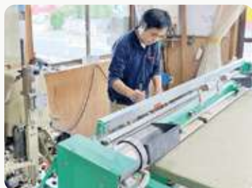
▲ マイコンスーパーリード6型