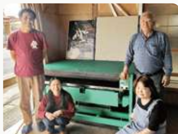
▲ スタンプと清水家の皆様