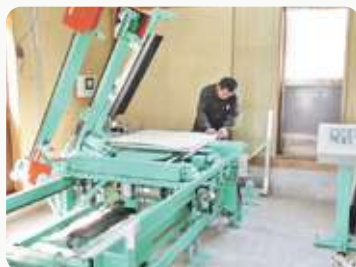
▲ ホープ MGAT2