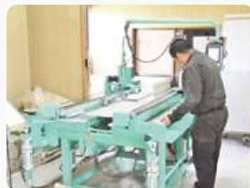
▲ オートツインベンダー