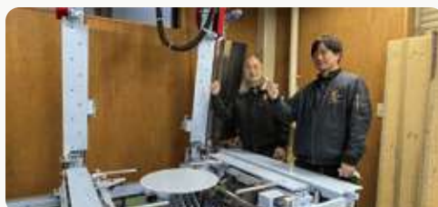
▲ ホープスター MGA \alpha 型