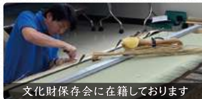
文化財保存会に在籍しております

日頃、目にする事の無い技能グラン プリ課題でもある板入れの手縫い畳 を見て研究して頂ければと思います。